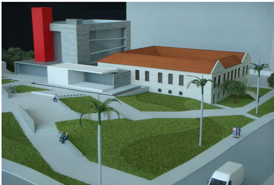
Figura 2: Visão lateral esquerda da maquete do complexo do Memorial da Anistia.