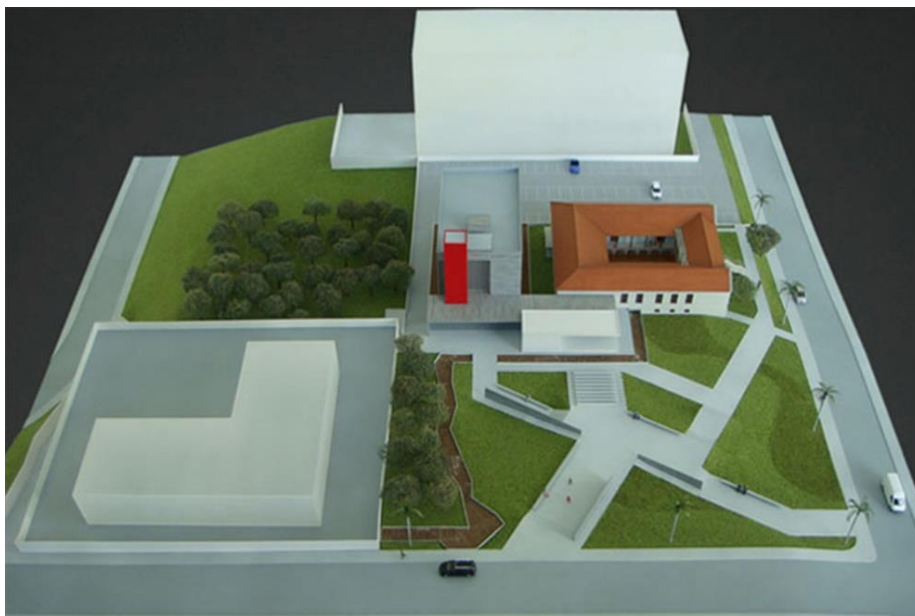
Figura 1: Maquete do Memorial da Anistia.

Ainda em 2009, foi contratada a empresa HS Maquetes para elaborar a maquete ( Figura 1 ) do Memorial da Anistia. O projeto é do arquiteto Mauro Alves Sacchi, e foi realizado em escala 1/87, com dimensões aproximadas de 150x140cm, conforme ilustrações abaixo: