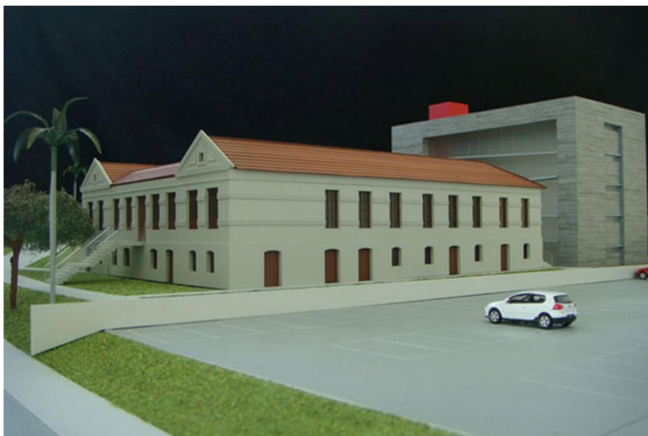
Figura 3: Visão lateral direita da maquete do Memorial da Anistia.

Com o projeto museográfico e a maquete definidos, o Ministério da Justiça em conjunto com a Universidade Federal de Minas Gerais escolheram a empresa Santa Rosa Bureau Cultural para coordenar e desenvolver a primeira etapa da concepção e articulação de implantação do Memorial da Anistia. Em 2009, ela ficou responsável pela gestão técnica e executiva do projeto, porém os únicos trabalhos realizados foram a organização e planejamento da proposta museográfica; produção de videografia e