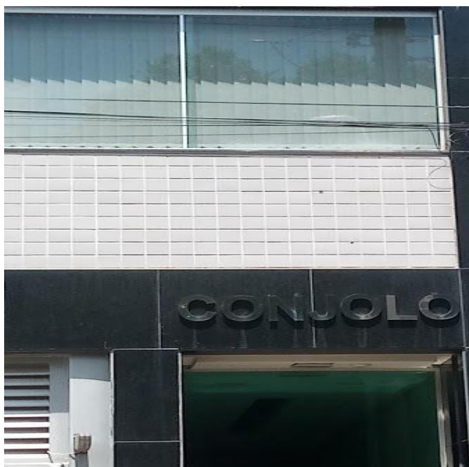
Figura 10- Prédio comercial Conjolo. Localizado no Centro da cidade de Bom Despacho.