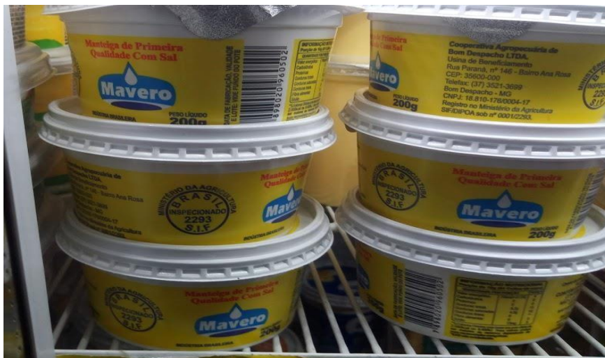
Figura 9- Produto lácteo- Manteiga Maverero Fonte: João Carlos Sousa Sada