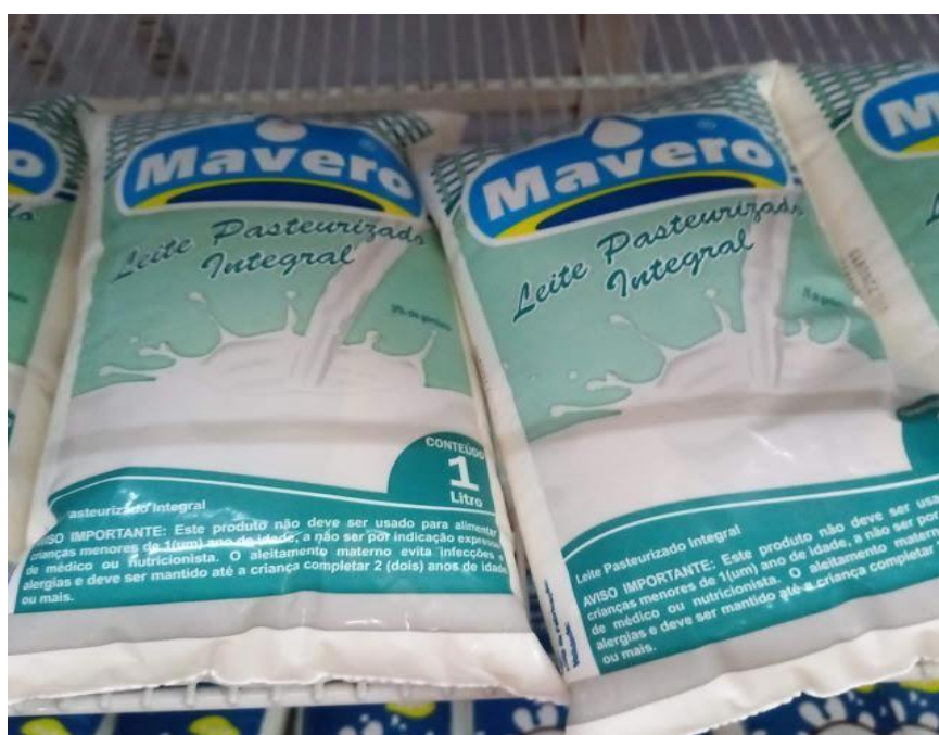
Figura 8 - Produto lácteo- Leite Maverero