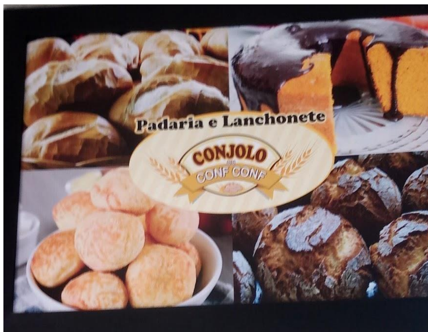
Figura 7 – Interior da Padaria e Lanchonete ConjoloduConf Conf.