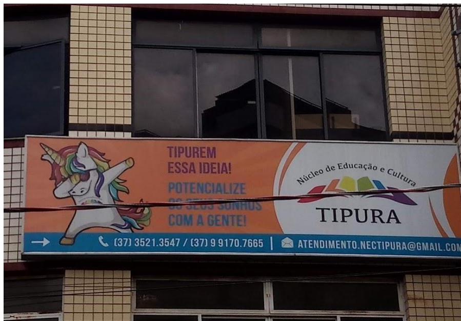
Figura 11- Colégio e Curso Preparatório Pré-Vestibular Tipura. Situado à Rua Coronel Tininho, Praça da Matriz, 201 - nº 40, sala - Centro, Bom Despacho – MG.