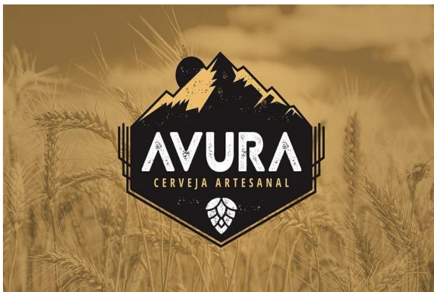
Figura 14- Cervejaria Artesanal Avura –Rua da Olaria, 505 Bom Despacho. MG