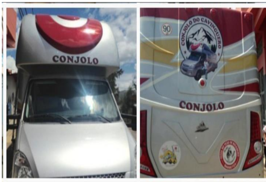
Figura 12- Transporte Conjolo do Cavinguero (Casa do Fazendeiro).