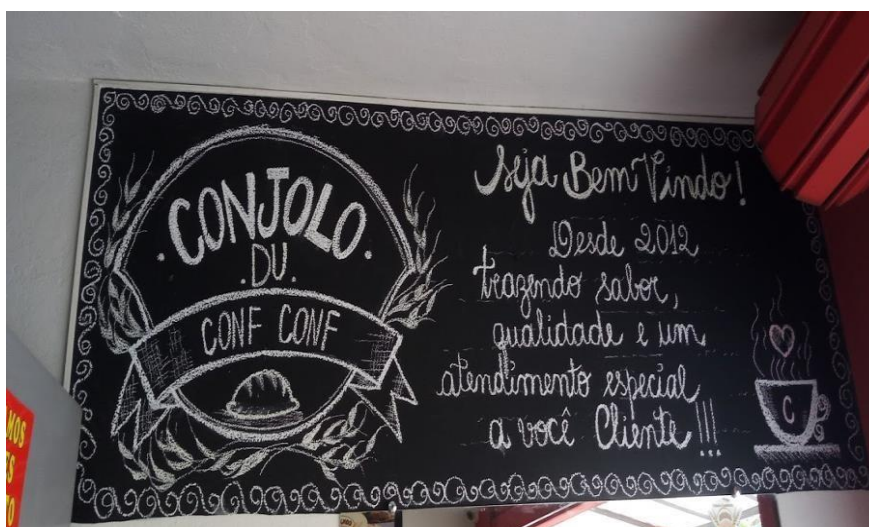
Figura 6- Interior da Padaria e Lanchonete Conjolo du Conf Conf.