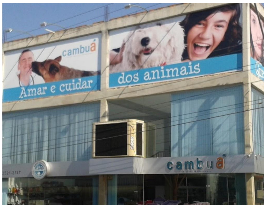
Figura 13- Hospital Veterinário Cambuá (Cachorro). Situado à Rua Lavinia Campos, nº 188. Bom Despacho – MG.