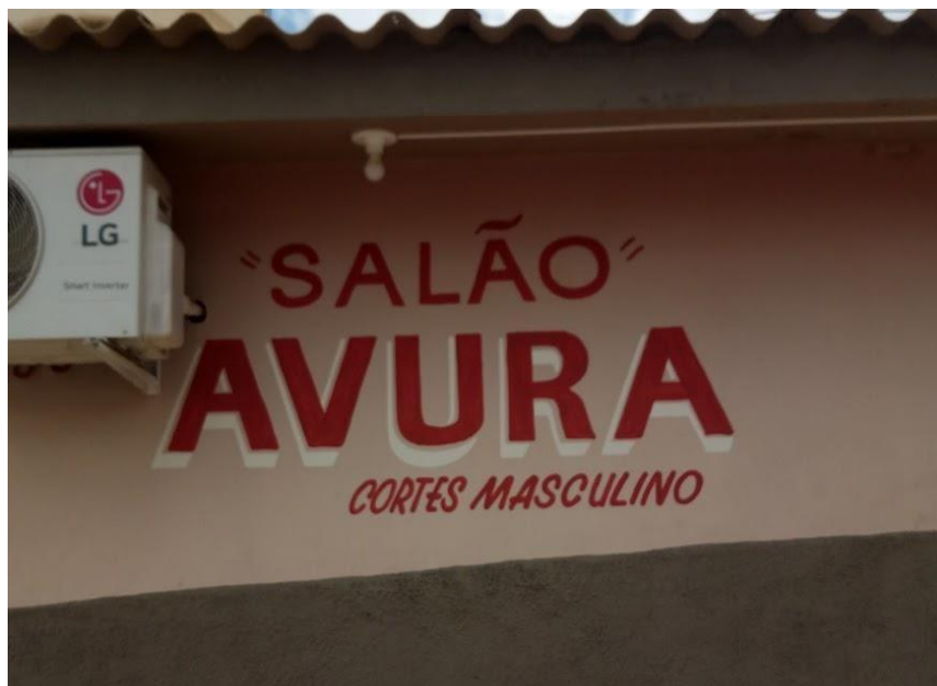
Figura 4- Salão Avura (grande, bonito, bom, etc) - cabeleireiro e barbearia

Através desse novo comportamento, a língua da Tabatinga deixa de ser uma língua falada somente por negros da periferia e assume um papel importante para a cidade de Bom Despacho, o de articulador da memória e da identidade afro-brasileira, formadoras da cultura presente na região. Os registros a seguir demonstram a conscientização de que a língua da Tabatinga está intrinsecamente ligada à cultura da cidade.