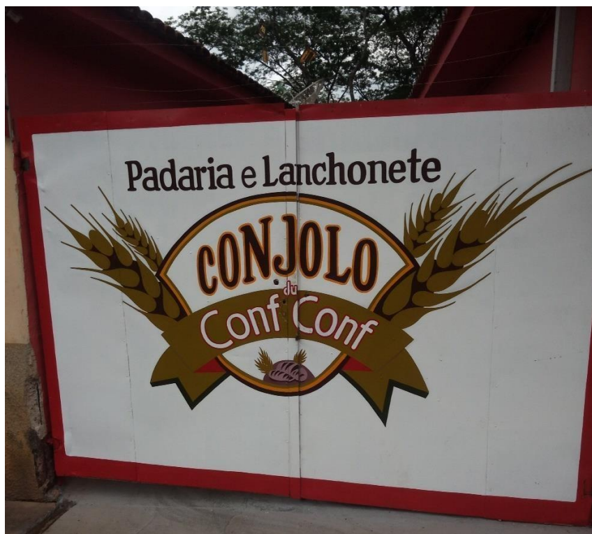
Figura 5- Padaria e Lanchonete Conjolo du Conf Conf