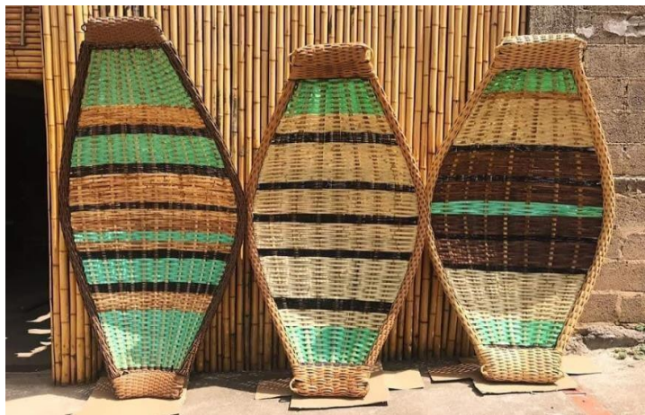
Figura 3 – Redes produzidas com bambu pelo artesão e conhecedor da língua da Tabatinga Beбето.

bares e restaurantes da cidade, além de outros ofícios pertinentes à região, como a pesca e o artesanato. (ver tabela 7).