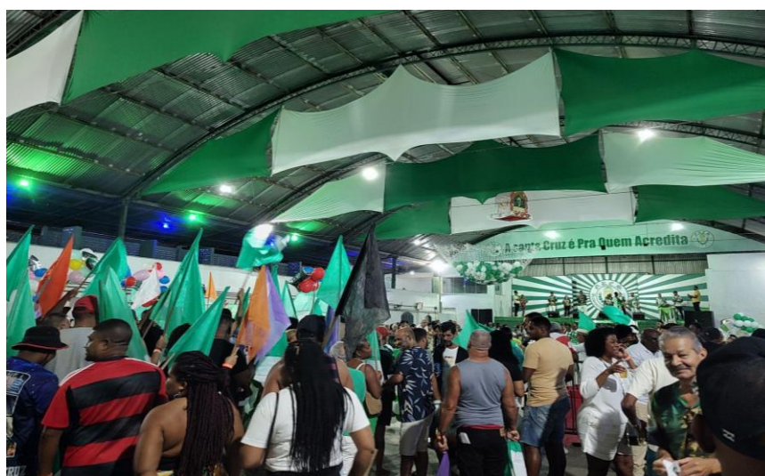
Foto 5- Quadra da Acadêmicos de Santa Cruz no dia da semifinal das eliminatórias dos sambas enredos.

No dia 19 de outubro de 2024 aconteceu a final das eliminatórias dos sambas enredos de 2025, o evento começou às 18h, mas só terminou por volta das 04 da manhã. Não estive presencialmente, mas acompanhei a transmissão online. Na ocasião, foi contratado um cantor para se apresentar. O espaço ficava cada vez mais cheio, tanto pelo show do cantor, tanto pela decisão de qual vai ser o samba vencedor. Houve apresentação da tabajara da zona oeste, a bateria da escola de samba, apresentando outros sambas da Acadêmicos, e depois apresentando os sambas concorrentes. O enredo da Santa Cruz de 2025 é Os Sagrados Altares Tupiniquins . O samba escolhido foi o samba de número 2: