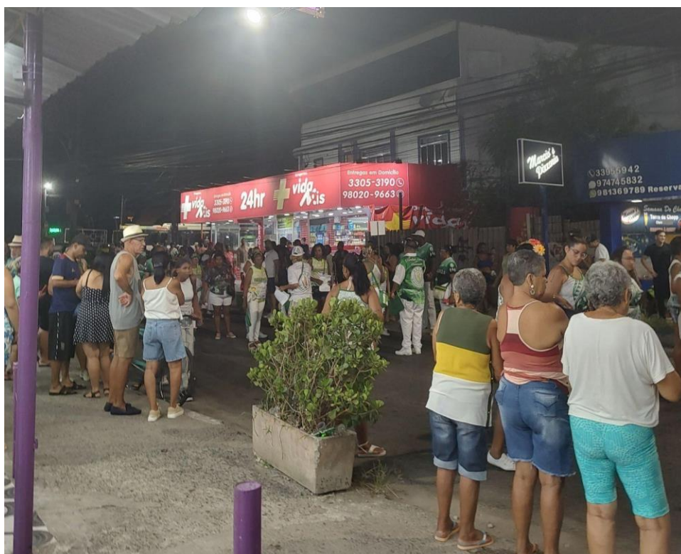
Foto 8 - Foto do ensaio de rua.

O desfile da Acadêmicos de Santa Cruz aconteceu no dia 3 de fevereiro de 2025 na Intendente Magalhães, a escola desfilou na Série Prata da superliga de carnaval, a torcida para escola estava presente na arquibancada, a comunidade se deslocou para apoiar a escola de samba. Não estive presente no dia, mas acompanhei pela internet.