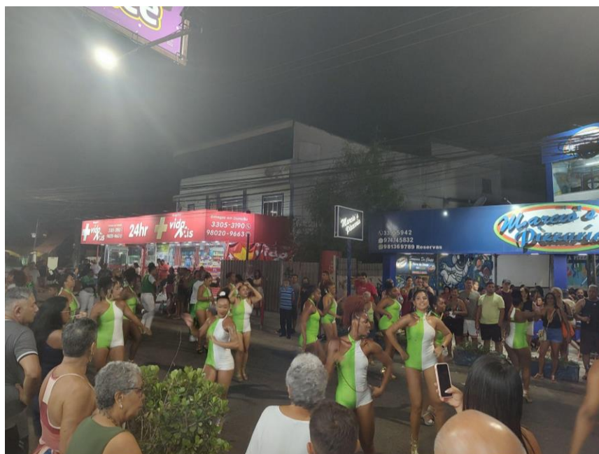
Foto 7 - Foto do ensaio de rua.