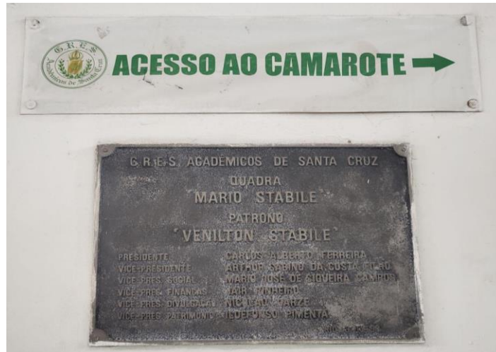
Foto 1 - Placa que mostra o patrono da escola, presidentes e vice-presidentes.