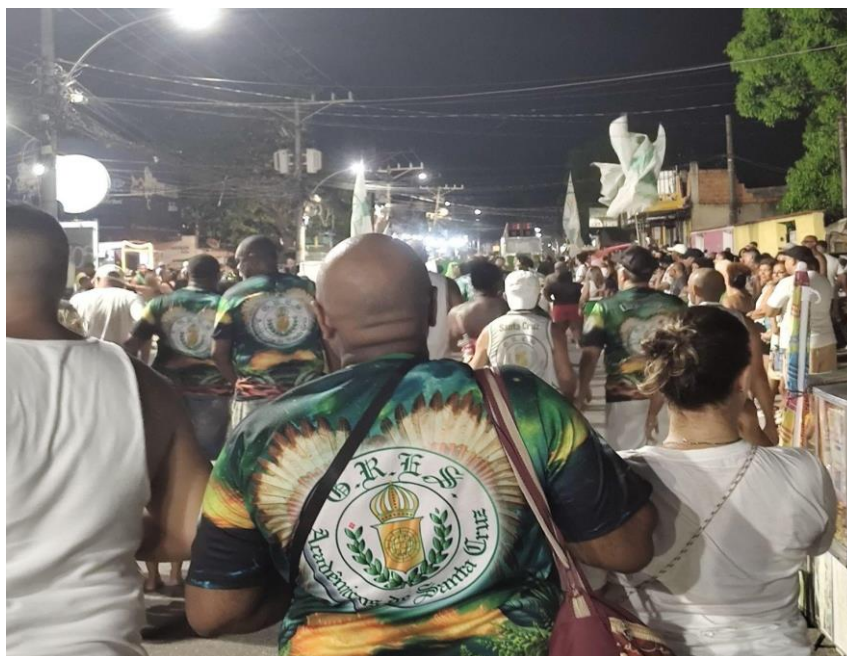
Foto 6 - Foto do ensaio de rua.

Foi o terceiro ensaio de rua da escola, o samba estava mais presente no canto das pessoas que acompanhavam o desfile, a rua cada vez mais cheia, é possível perceber a inclusão da escola de pessoas LGBTQIA+, várias crianças se divertindo e sambando. O desfile na rua movimentava o comércio local, as lojas que vendem comida na rua do ensaio ficam cheias.