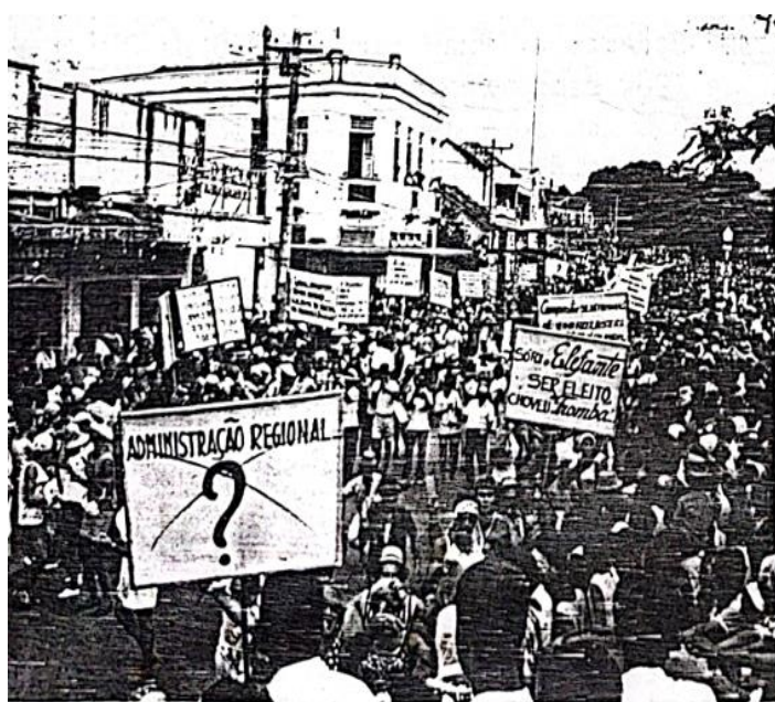
Imagem 2 - Imagem de um dos desfiles do Bloco da Crítica com uma placa riscada em “X” para ser censurada. Fonte: Documento do arquivo do Núcleo de Orientação e Pesquisa Histórica de Santa Cruz (NOPH).