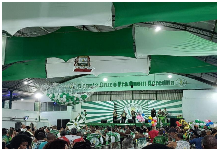
Foto 4- Quadra da Acadêmicos de Santa Cruz no dia da semifinal das eliminatórias dos sambas enredos.