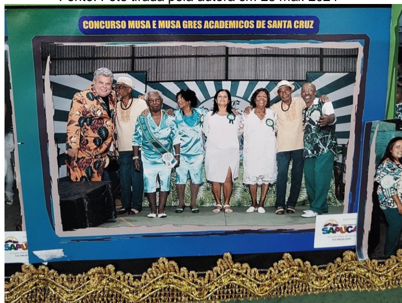
Foto 2- Concurso de Musa e musa G.R.E.S Acadêmicos de Santa Cruz.