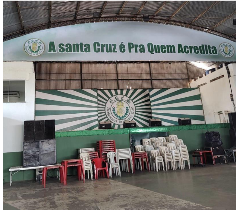
Foto 3 - Foto da quadra da Acadêmicos de Santa Cruz.

No dia 6 de outubro de 2024, foi a semifinal das eliminatórias dos sambas enredos de 2025. A quadra estava cheia, torcidas com bandeiras, desfiles das portas bandeiras e dos passistas, velha-guarda presente desde o começo (a escola tem uma sala para a velha guarda). Muita gente da comunidade ao redor participando da decisão, foram 4 sambas concorrendo no dia 06, a final da escolha dos sambas é dia 19/10 com um evento de samba. Pude perceber muitos tipos de representatividade: negra, trans, idosos, crianças. Com o passar das horas o espaço foi ficando pequeno devido às torcidas.