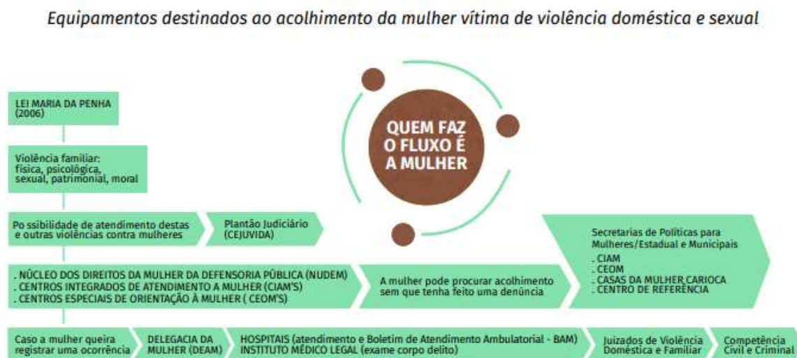
Figura 3 - Organograma dos equipamentos destinados ao atendimento para violência doméstica e sexual.