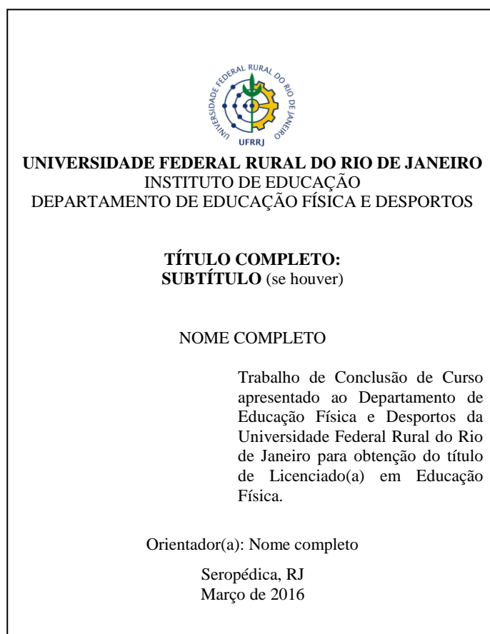
Folha de rosto