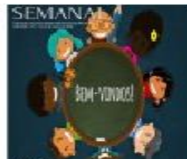
Figura 1. Rural Semanal