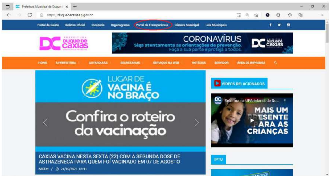
Figura 3- Página inicial Prefeitura de Duque de Caxias