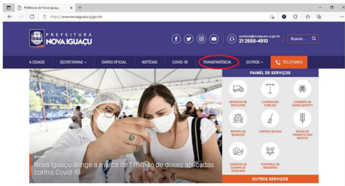
Figura 4- Página inicial Prefeitura de Nova Iguaçu