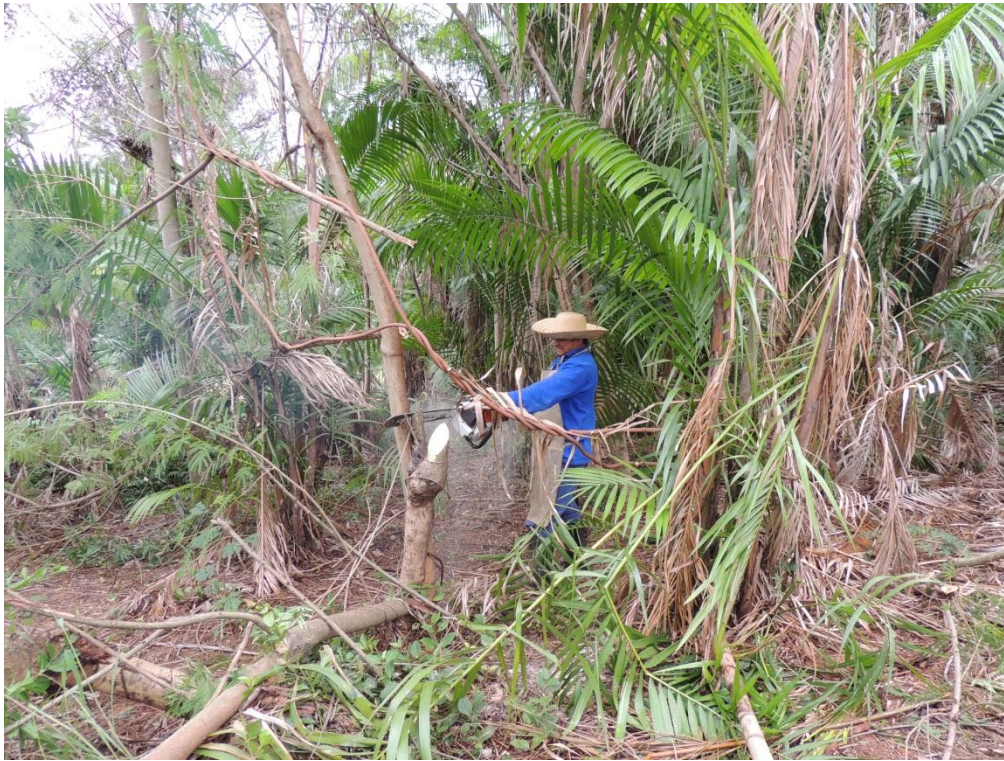
Figura 4: Poda das árvores de adubação verde com motosserra, uma das parcelas de acácia do SAF, Campo Experimental da Embrapa Agrobiologia, Seropédica, RJ.