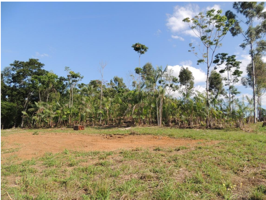
Figura 16: Vista geral do experimento de SAF com tratamentos de adubação verde, após o manejo das parcelas, Campo Experimental da Embrapa Agrobiologia, Seropédica, RJ.