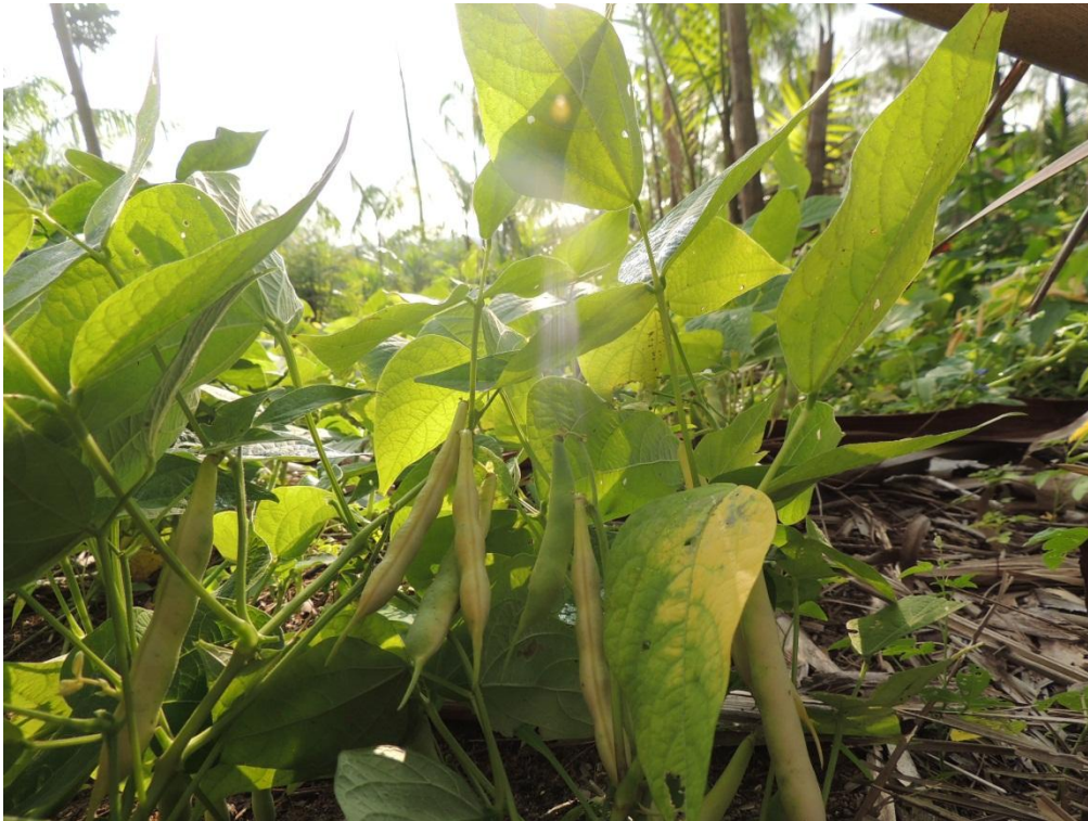
Figura 13: Plantas de feijão quase no ponto de colheita com as vagens amarelando e planta senescendo no SAF, Campo Experimental da Embrapa Agrobiologia, Seropédica, RJ.

Somente para avaliação da produtividade foram coletados mais 6 m 2 , consistindo em 3 m lineares de duas linhas duplas adjacentes as duas linhas centrais das subparcelas. Os grãos foram pesados e somados com a produção dos 4 m 2 totalizando 10 m 2 por subparcela.