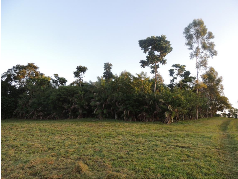
Figura 15: Vista geral do experimento de SAF com tratamentos de adubação verde, antes do manejo das parcelas, Campo Experimental da Embrapa Agrobiologia, Seropédica, RJ.