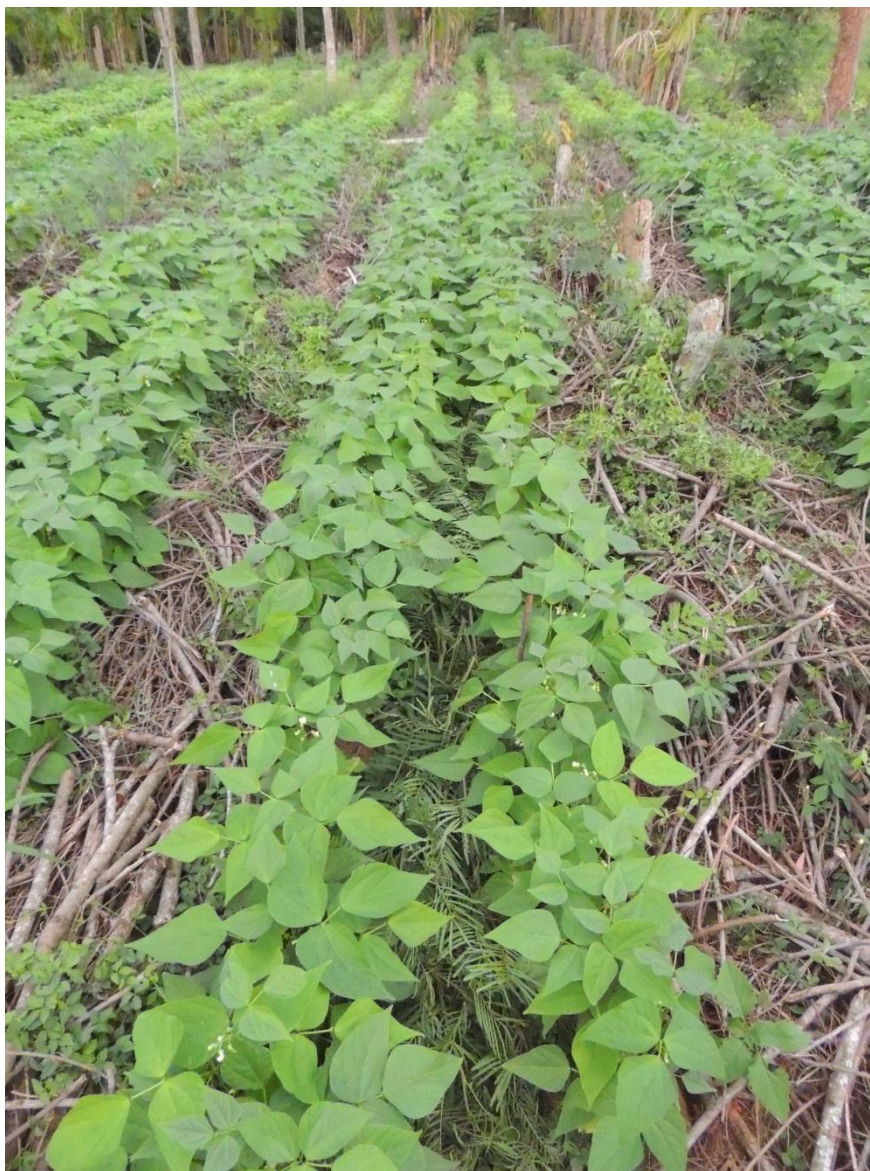
Figura 11: Biomassa vegetal da 2ª poda nas parcelas de acácia do SAF depositadas nas linhas duplas de feijão (34 DAP), Campo Experimental da Embrapa Agrobiologia, Seropédica, RJ.