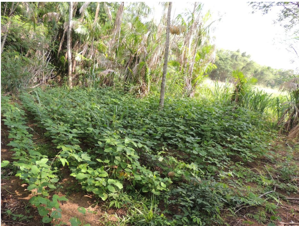
Figura 3: Feijão-de-porco já estabelecido em parcela do SAF, Campo Experimental da Embrapa Agrobiologia, Seropédica, RJ.