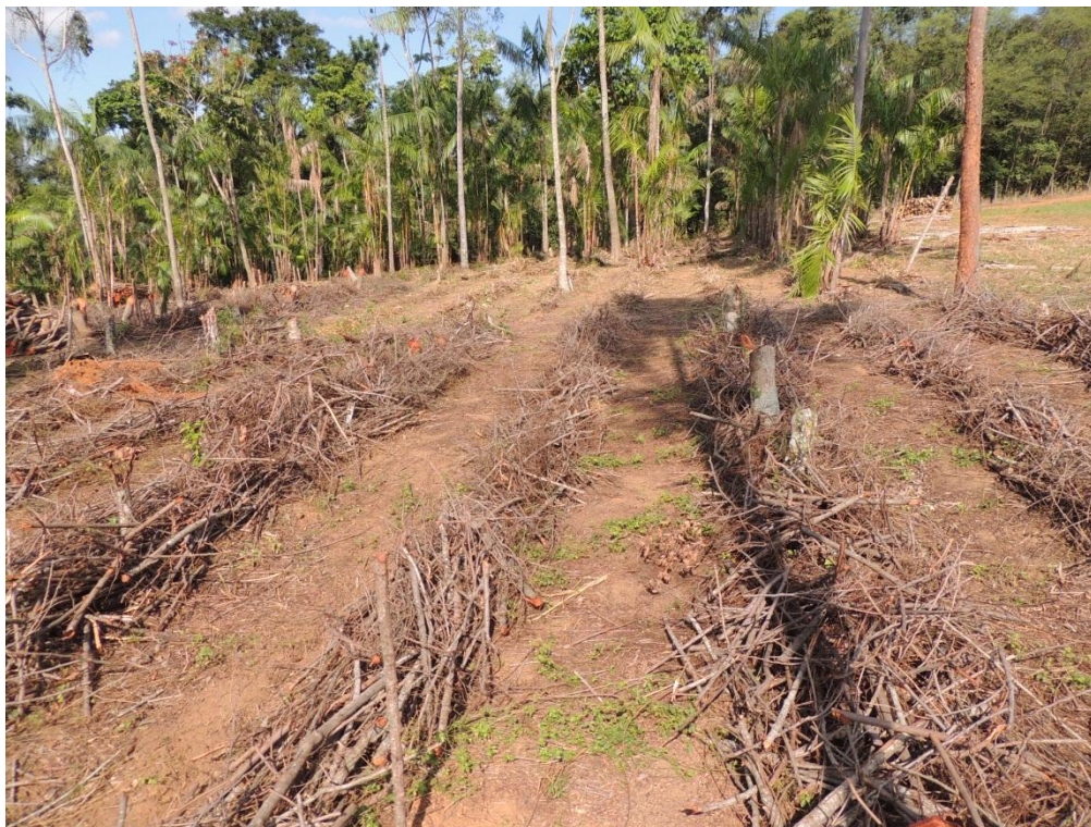
Figura 7: Material enleirado nas parcelas para o plantio de feijão nas entrelinhas do SAF, Campo Experimental da Embrapa Agrobiologia, Seropédica, RJ.