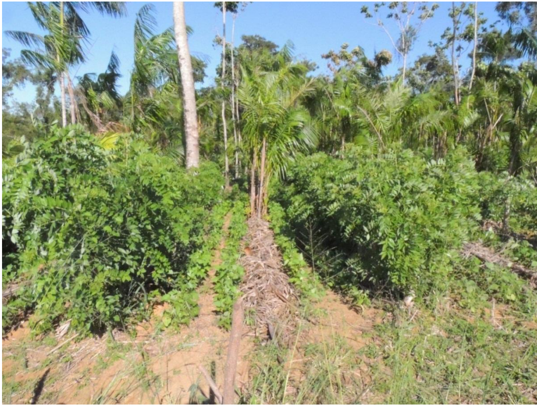
Figura 17: Parcela do tratamento com gliricídia com brotações sombreando o feijoeiro nas linhas mais próximas as aléias do SAF, Campo Experimental da Embrapa Agrobiologia, Seropédica, RJ.