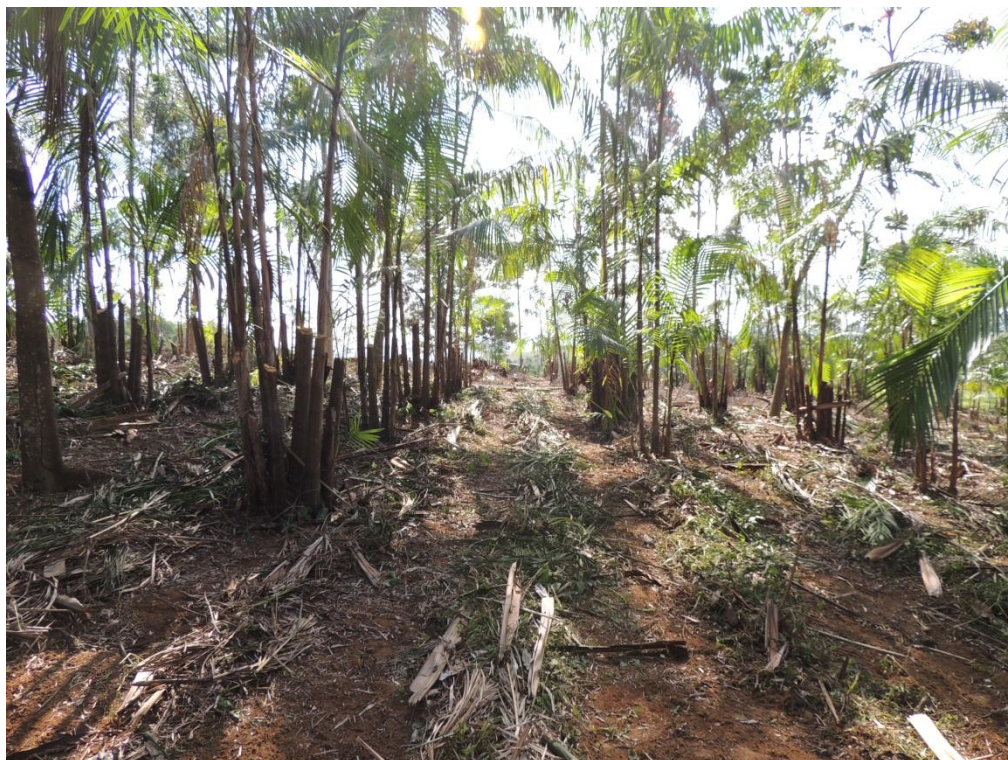
Figura 6: Visão geral do SAF após o manejo das parcelas, destacando as estipes de açaí que permaneceram e o enleiramento da biomassa vegetal nas parcelas, Campo Experimental da Embrapa Agrobiologia, Seropédica, RJ.