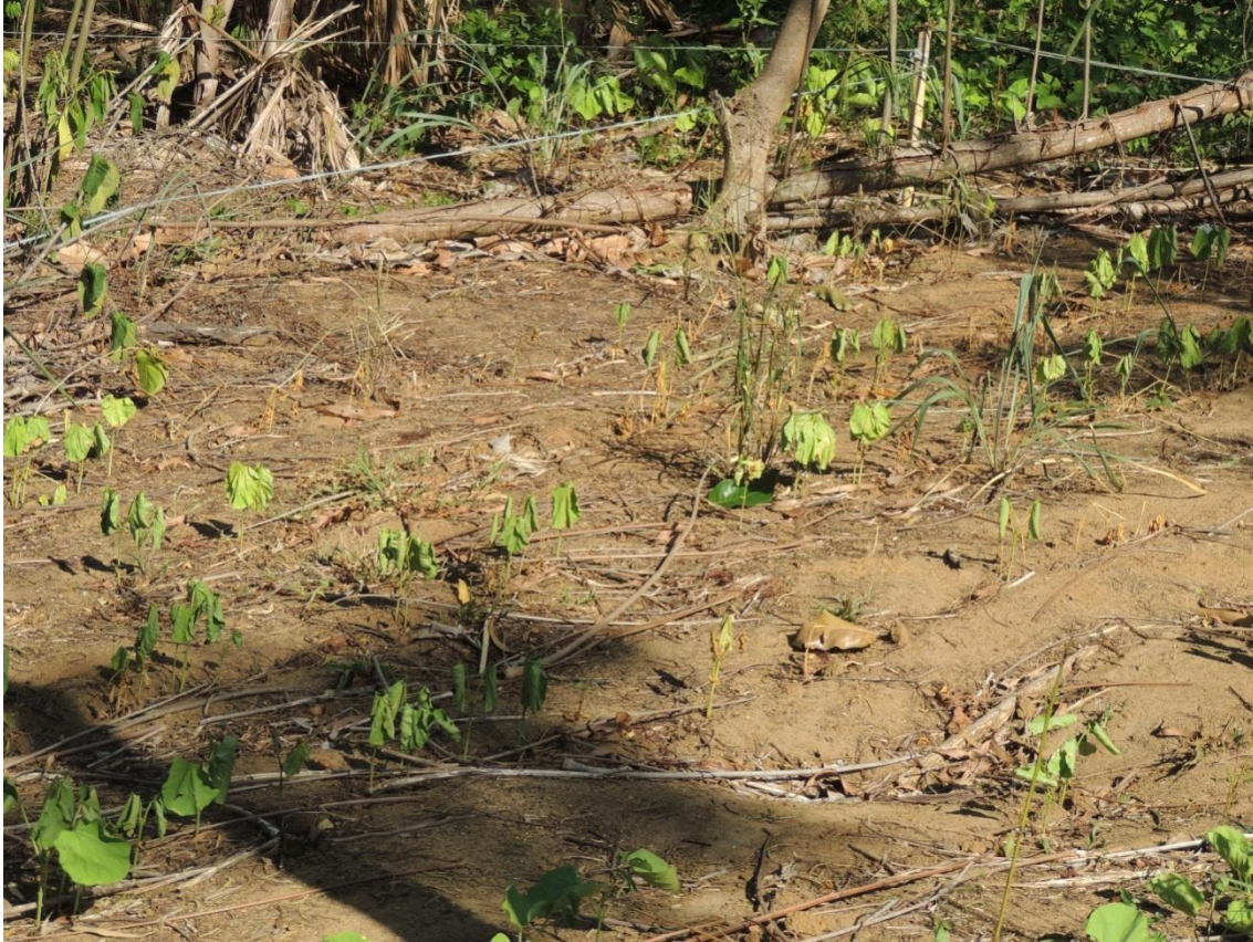
Figura 14: Plantas de feijão-de-porco sofrendo com deficit hídrico durante o período seco do verão, 26 dias após o plantio. Campo Experimental da Embrapa Agrobiologia, Seropédica, RJ.

As parcelas de feijão-de-porco, quando o experimento foi montado, eram compostas por kudzu tropical ( Pueraria phaseoloides (Roxb.) Benth.), que é uma planta que possui hábito trepador, podendo ter competido com o açaí, ramando em seus perfilhos. No estudo de Paula et al., (2015), a produção de biomassa do kudzu foi de 44,92 Mg ha -1 superou quase que as duas adubações arbóreas juntas 22,42 Mg ha -1 para acácia e 23,5 Mg ha -1 para gliricídia no somatório dos desbastes de 1 ano, reforçando a possibilidade do kudzu ter competido com os açaís.