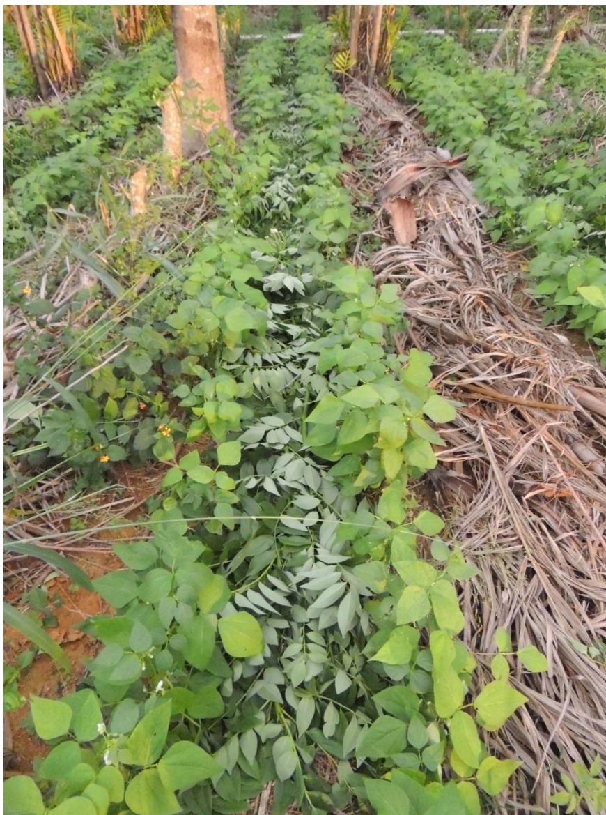
Figura 12: Biomassa vegetal da 2ª poda nas parcelas de gliricída do SAF depositadas nas linhas duplas de feijão (34 DAP), Campo Experimental da Embrapa Agrobiologia, Seropédica, RJ.