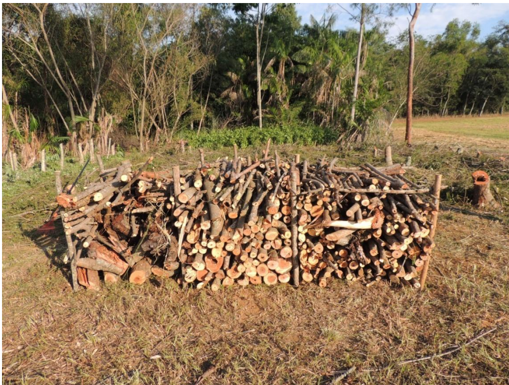
Figura 5: Lenha produzida com diâmetro \geq 5 cm a partir das podas das parcelas do SAF empilhada para cubagem da madeira, Campo Experimental da Embrapa Agrobiologia, Seropédica, RJ.