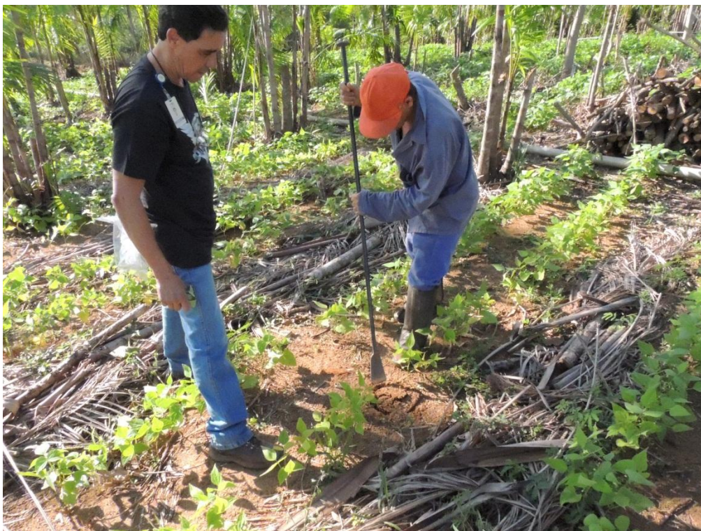
Figura 10: Coleta do sistema radicular das plantas de feijoeiro para avaliação da nodulação aos 35 DAPL nas parcelas do SAF, Campo Experimental da Embrapa Agrobiologia, Seropédica, RJ.