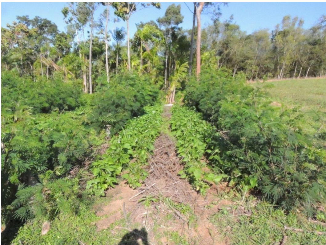
Figura 18: Parcela do tratamento com acácia com brotações que não limitaram o crescimento do feijoeiro nas linhas mais próximas as aléias do SAF, Campo Experimental da Embrapa Agrobiologia, Seropédica, RJ.