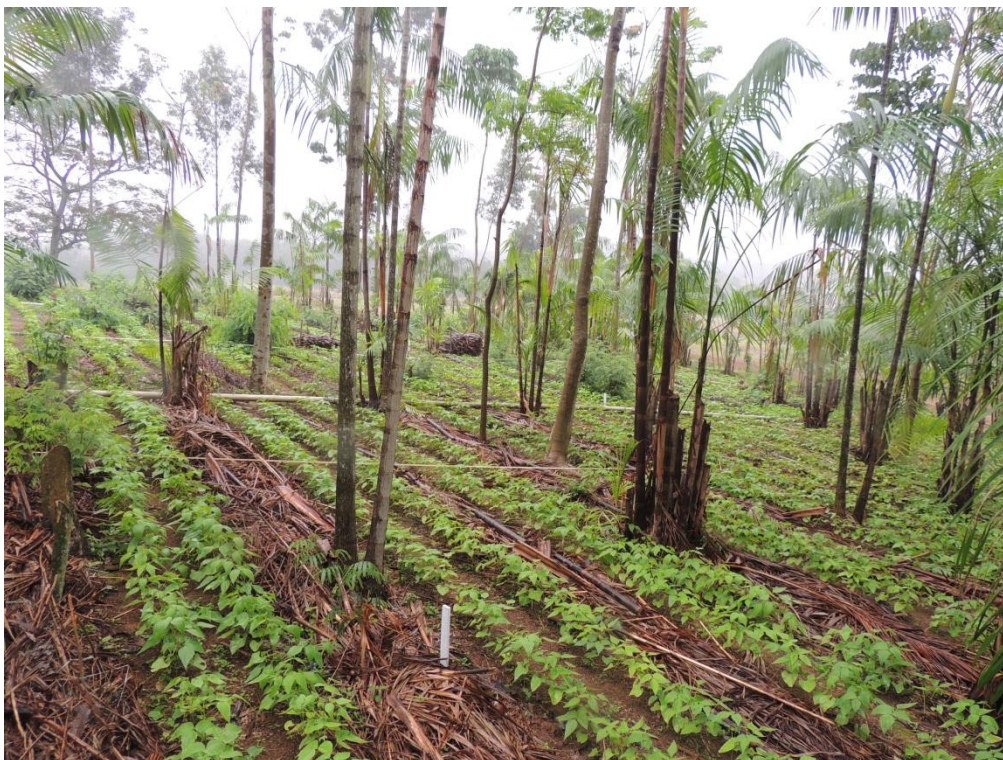
Figura 9: Visão geral do experimento com os feijões após 28 dias de plantio, Campo Experimental, Embrapa Agrobiologia, Seropédica, RJ.