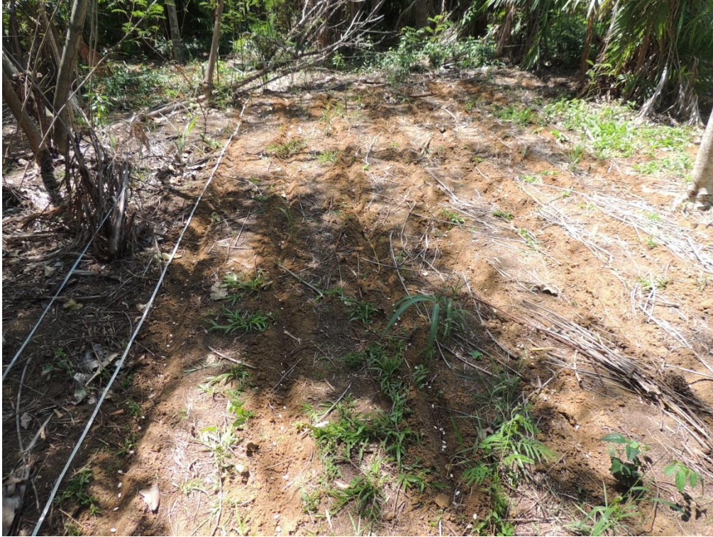
Figura 2: Plantio de linhas de plantio de feijão-de-porco em parcela do SAF, Campo Experimental da Embrapa Agrobiologia, Seropédica, RJ.