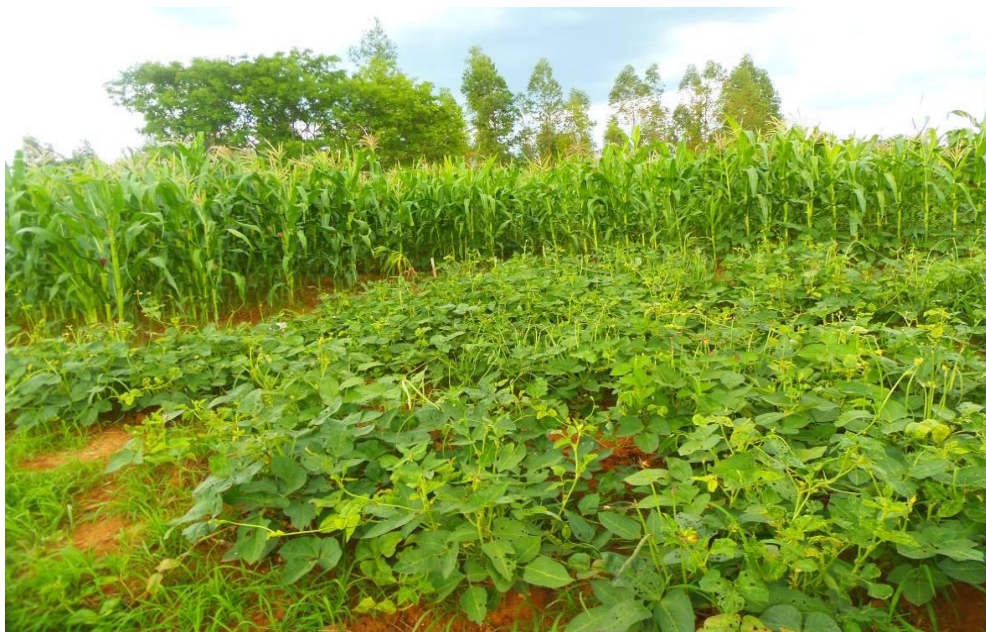
Figura 2 Aspecto do feijão-caupi cv.Itaim aos 55 DAP, Campus Januária IFNMG, período de coleta dos nódulos. Foto: Henrique, S. L. ( 04/11/2013).