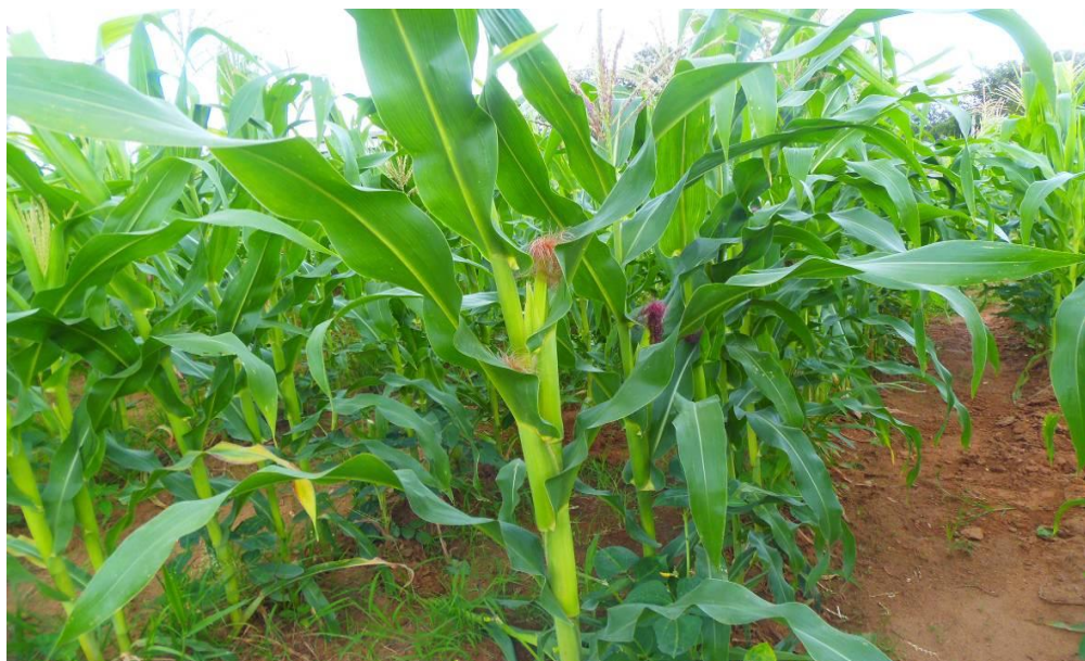
Figura 3 - Aspecto do milho Caatingueiro com 55 DAP, Campus Januária IFNMG, período de coleta dos nódulos. Foto: Henrique, S. L. ( 04/11/2013).